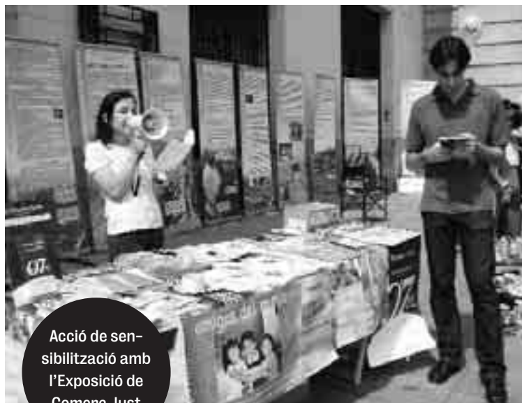
Acció de sensibilització amb l'Exposició de Comerç Just