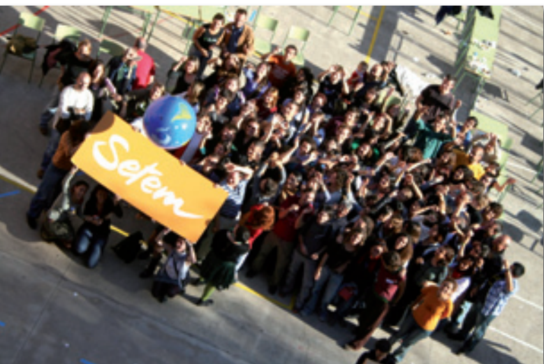
L'equip de SETEM a la Trobada General de Sòcies i Sòcis i Vents del Sud 2009. Barcelona, octubre 2009.

SETEM som un grup de persones que promovem transformacions personals i col·lectives per aconseguir un món més just.