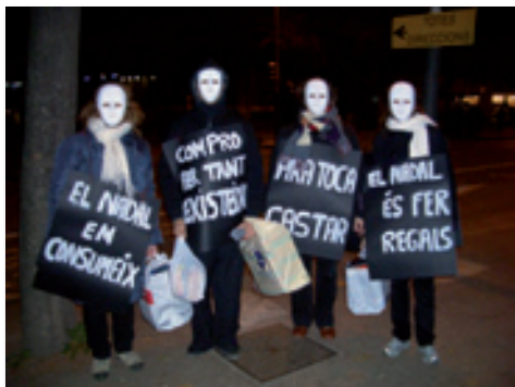
Acció de sensibilització sobre consum responsable de la Delegació de Girona. Girona, desembre 2009.