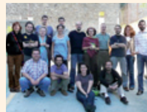
Assemblea de la Federació SETEM a Santiago de Compostela, 2009.

Formem part de la Federació SETEM, integrada per 10 associacions autonòmiques d'arreu d'Espanya. És la nostra principal xarxa de relacions i de treball conjunt en l'àmbit de l'Estat espanyol. La Federació compta amb una secretaria tècnica a Barcelona i SETEM Catalunya n'exerceix la presidència. A més de les activitats pròpies de cada associació membre, també hem desenvolupat diverses activitats de forma conjunta: la campanya Roba Neta, el programa El Bon Cafè és bo per a tothom o la campanya Finances Ètiques.