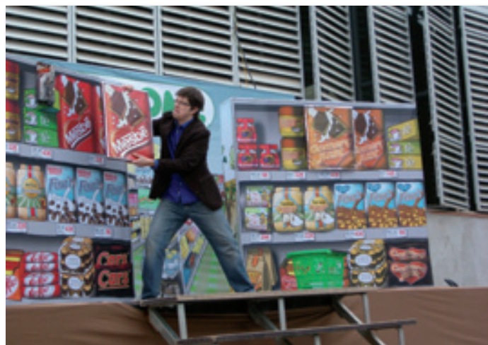
Un moment de l'obra Agredolç a Viladecavalls, 2009.

Oferim un seguit de Recursos de Sensibilització que engloben tres espectacles lúdico-festius i educatius, sobre el cafè, el cacau i la indústria tèxtil; dos tallers sobre Consum Responsable; diversos recursos audiovisuals; quatre exposicions mòbils sobre el Comerç Just, les Finances Ètiques, el Deute Extern i el Consum Responsable; i quatre jocs aptes per utilitzar a festes de Comerç Just i altres ocasions.