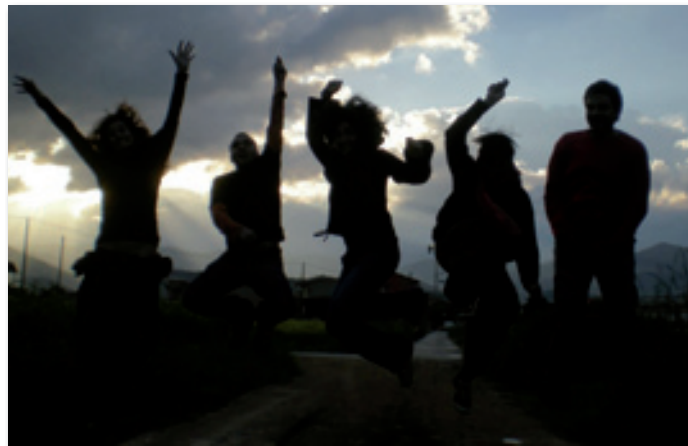
Fotografia de portada: 'Alumnes del Postgrau Agents de Desenvolupament Internacional', edició 40a.

SETEM Catalunya, persones que ens movem per transformar el món.