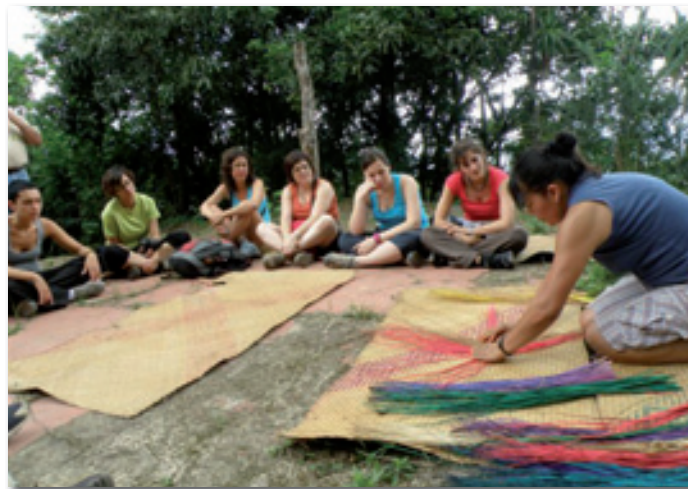
Ruta Solidària 2009 a Costa Rica.

Es tracta d'una proposta de turisme compromès, atent a la realitat social i respectuós amb el medi ambient. Una manera de conèixer els països econòmicament més empobrits del planeta a través de la qual els viatgers poden apropar-se a les inquietuds dels homes i les dones dels països del Sud: convivint amb una família del Senegal, escoltant el testimoni dels joves brasilers d'una favela de Rio, escoltant la realitat social d'una dona de l'Índia o sentint com a pròpies les dificultats d'un camp de refugiats tibetans al Nepal.