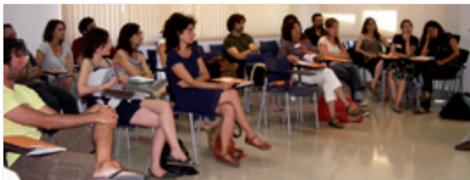
Postgrau en Desenvolupament Internacional, edició 48a.