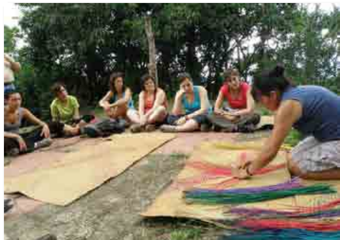
Ruta Solidaria 2009 en Costa Rica.

Se trata de una propuesta de turismo comprometido, atento a la realidad social y respetuoso con el medio ambiente. Una manera de conocer los países económicamente más empobrecidos del planeta a través de la cual los viajeros pueden acercarse a las inquietudes de los hombres y las mujeres de los países del Sur: conviviendo con una familia de Senegal, escuchando el testimonio de los jóvenes brasileños de una favela de Río, escuchando la realidad social de una mujer de la India o sintiendo como propias las dificultades de un campo de refugiados tibetanos en Nepal.