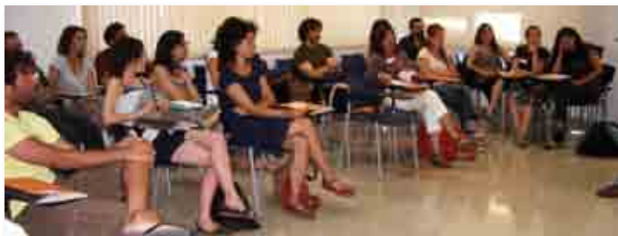
Postgrado en Desarrollo Internacional, 48ª edición.

>>> En total, el año 2009 formamos a 210 alumnos..