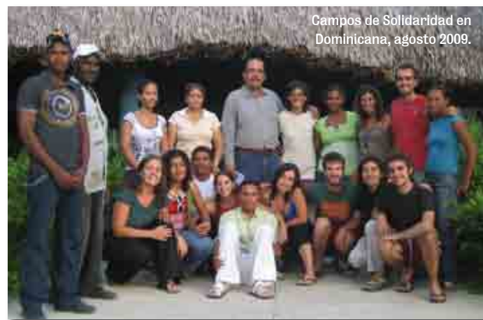
Campos de Solidaridad en Dominicana, agosto 2009.