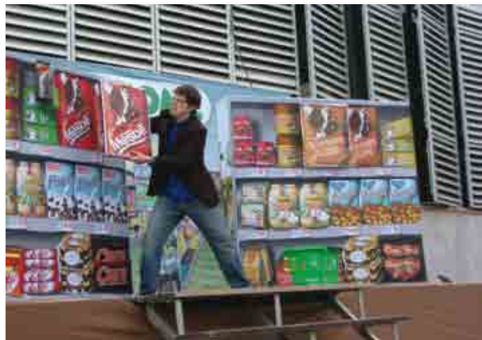
Un momento de la obra 'Agredolç' en Viladecavalls, 2009.

Ofrecemos una serie de Recursos de Sensibilización que engloba tres espectáculos lúdico-festivos y educativos, sobre el café, el cacao y la industria textil; dos talleres sobre consumo responsable; diversos recursos audiovisuales; cuatro exposiciones móviles sobre el Comercio Justo, Finanzas Éticas, la Deuda Externa y el Consumo Responsable; y cuatro juegos aptos para utilizar en fiestas de Comercio Justo y otras ocasiones.