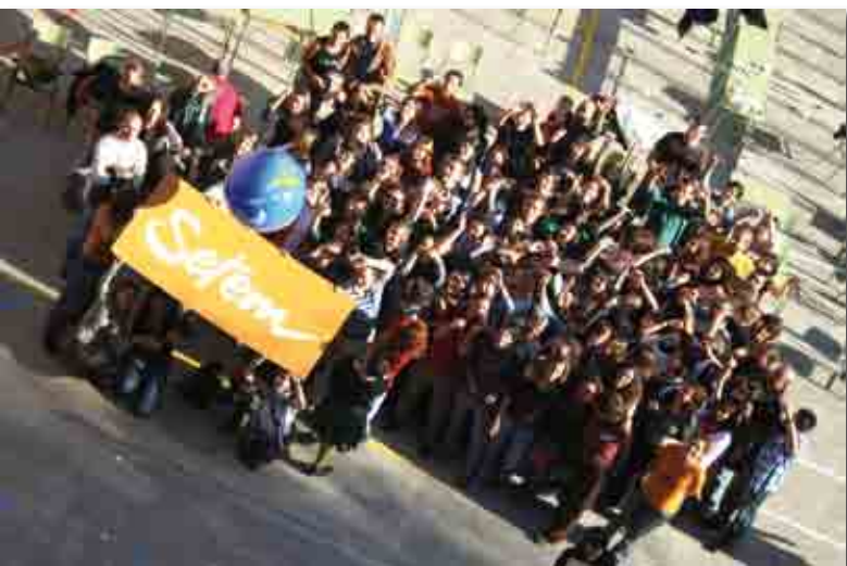
El equipo de SETEM en el Encuentro General de Socias y Socios y Vientos del Sur 2009. Barcelona, octubre 2009.

SETEM somos un grupo de personas que promovemos transformaciones personales y colectivas para conseguir un mundo más justo.