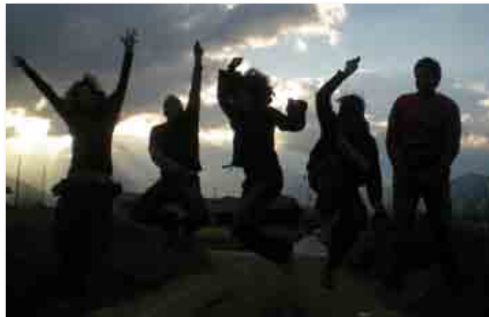
Fotografía de portada: 'Alumnos del Postgrado Agentes de Desarrollo Internacional', edición 40º.