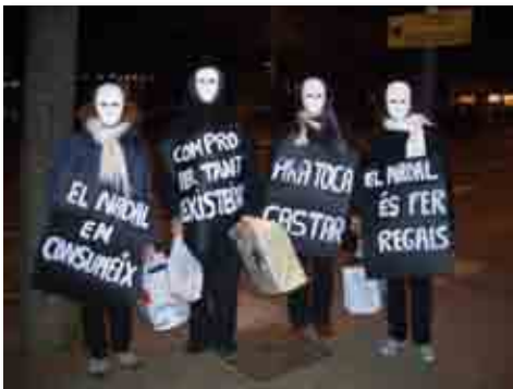
Acción de sensibilización para un consumo responsable de la Delegación de Girona. Girona, diciembre 2009.

Formamos parte de la red internacional Enlazando Alternativas, las campañas Clean Clothes Campaign y Stop EPA, y BankTrack.