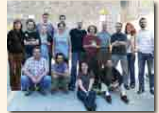
Asamblea de la Federación SETEM en Santiago de Compostela, 2009.

Formamos parte de la Federación SETEM, integrada por 10 asociaciones autonómicas de toda España. Es nuestra principal red de relaciones y de trabajo conjunto en el ámbito del Estado español. La Federación cuenta con una secretaría técnica en Barcelona y SETEM Catalunya ejerce la presidencia. Además de las actividades propias de cada asociación miembro, también hemos desarrollado diversas actividades de forma conjunta: la campaña Ropa Limpia, el programa El Buen Café es bueno para todos o la campaña Finanzas Éticas.